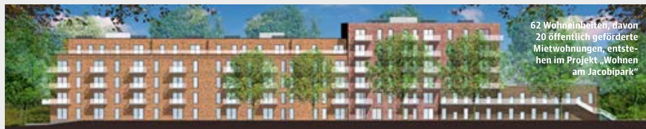
62 Wohneinheiten, davon 20 öffentlich geförderte Mietwohnungen, entstehen im Projekt „Wohnen am Jacobipark“

Weitere Informationen: www.hansa-baugenossenschaft.de und www.deutsche-immobilien.ag